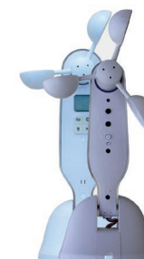
Sensor viento-sol Wind-sun sensor