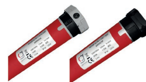
Motor para toldo Awning motor