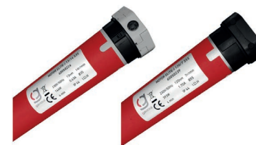
Motor para toldo cofre The box awning motor